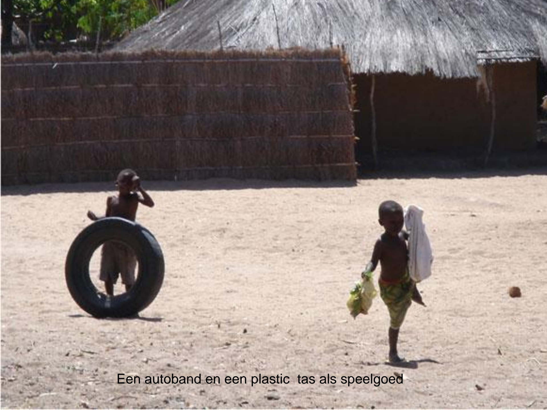
Een autoband en een plastic tas als speelgoed