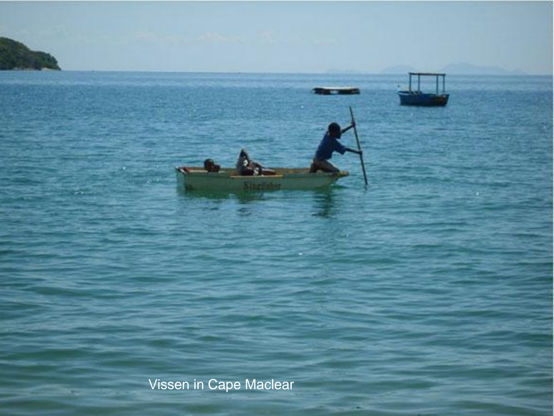
Vissen in Cape Maclear