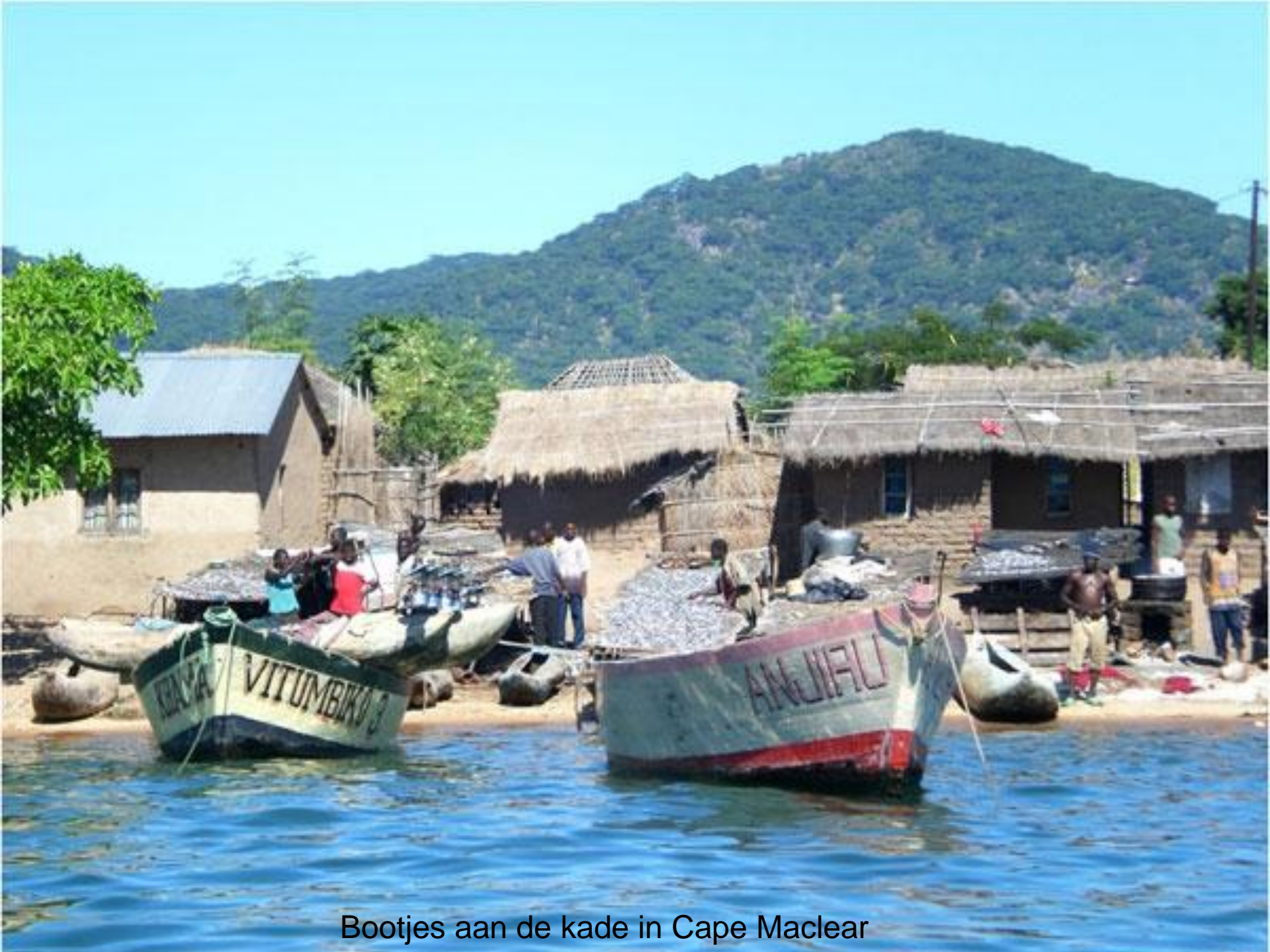
Bootjes aan de kade in Cape Maclear