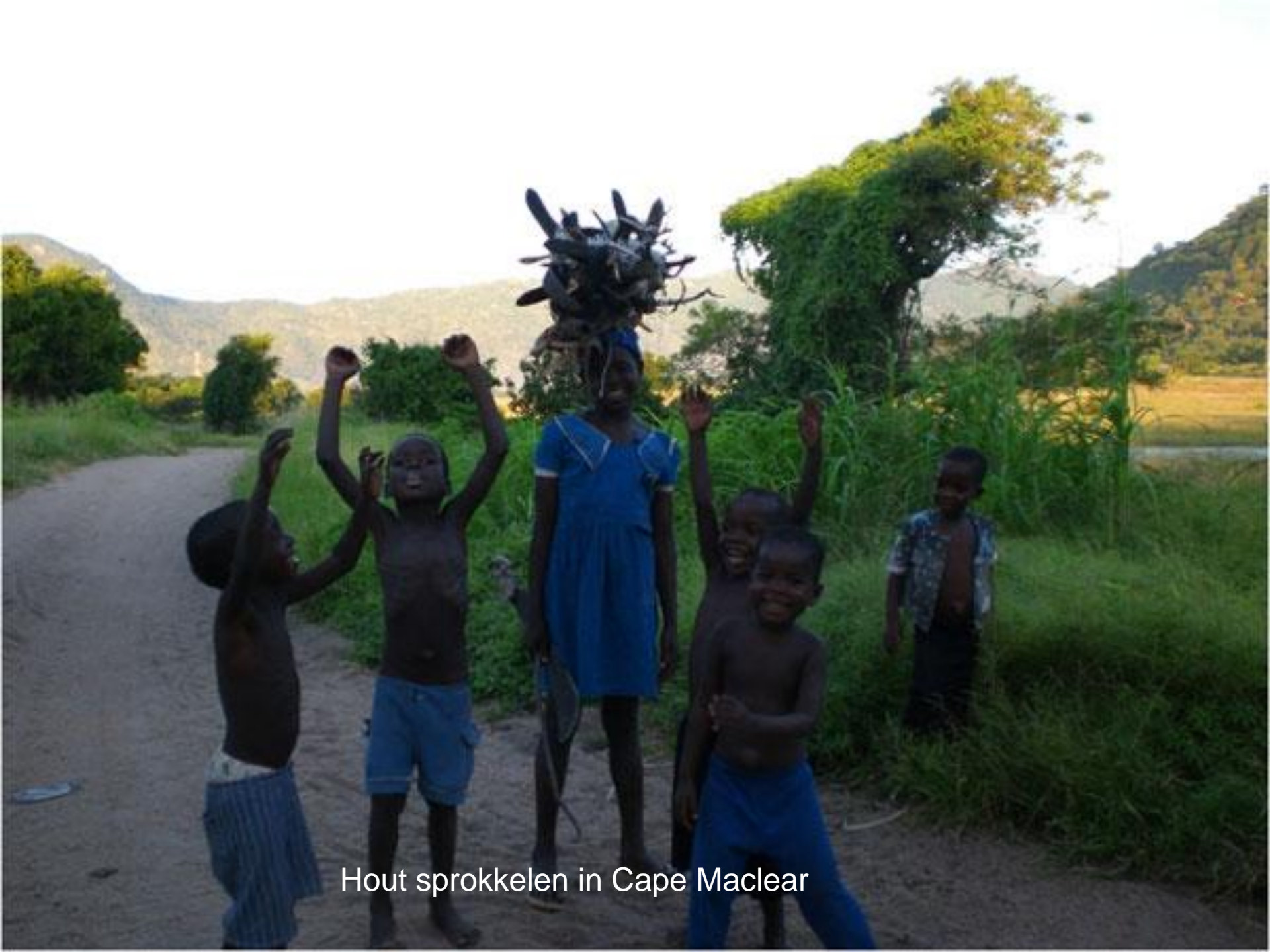
Hout sprokkelen in Cape Maclear