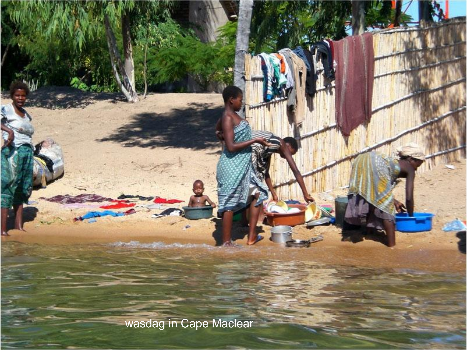
wasdag in Cape Maclear