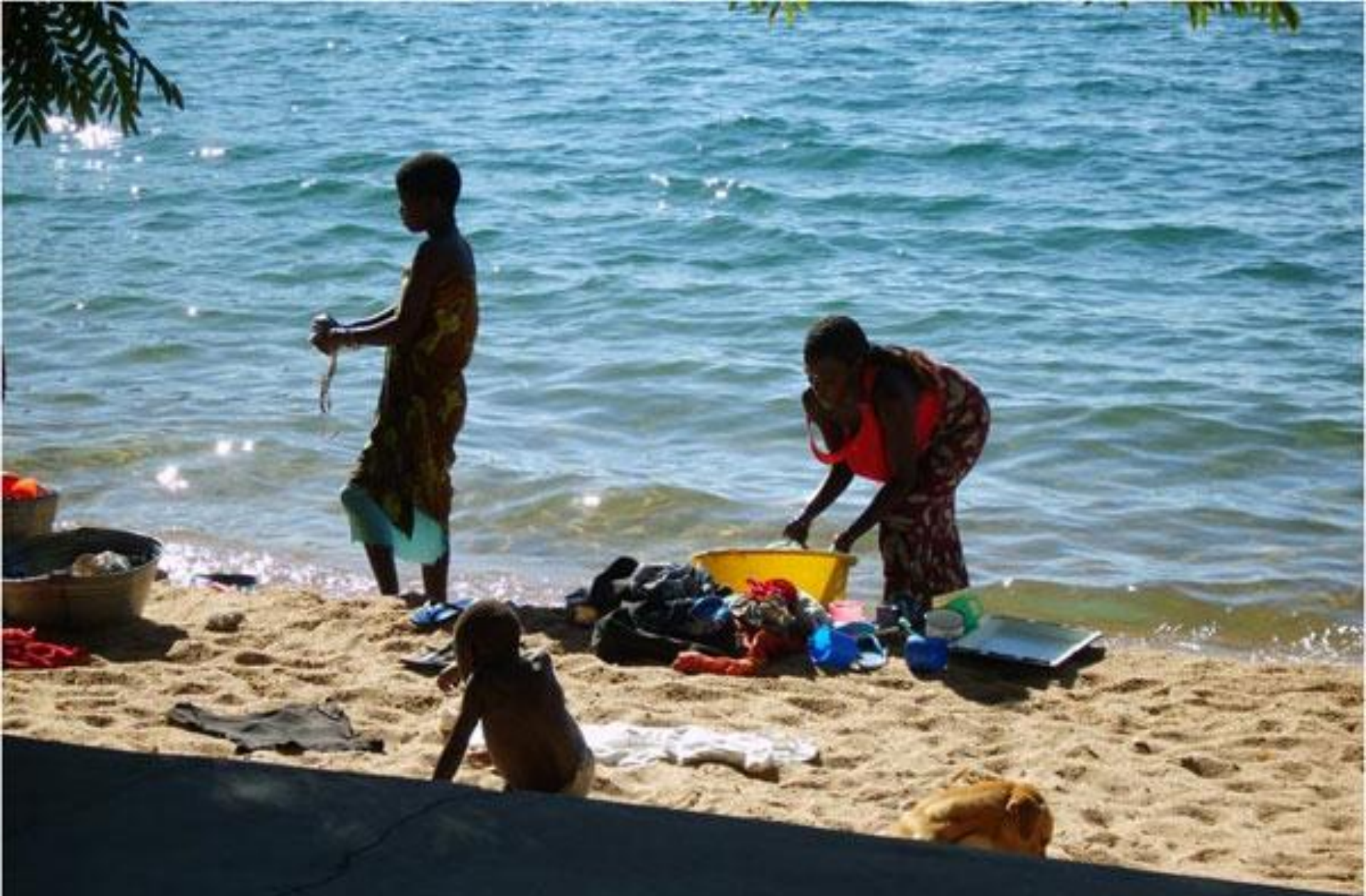
De was wordt aan het strand bij het meer gedaan