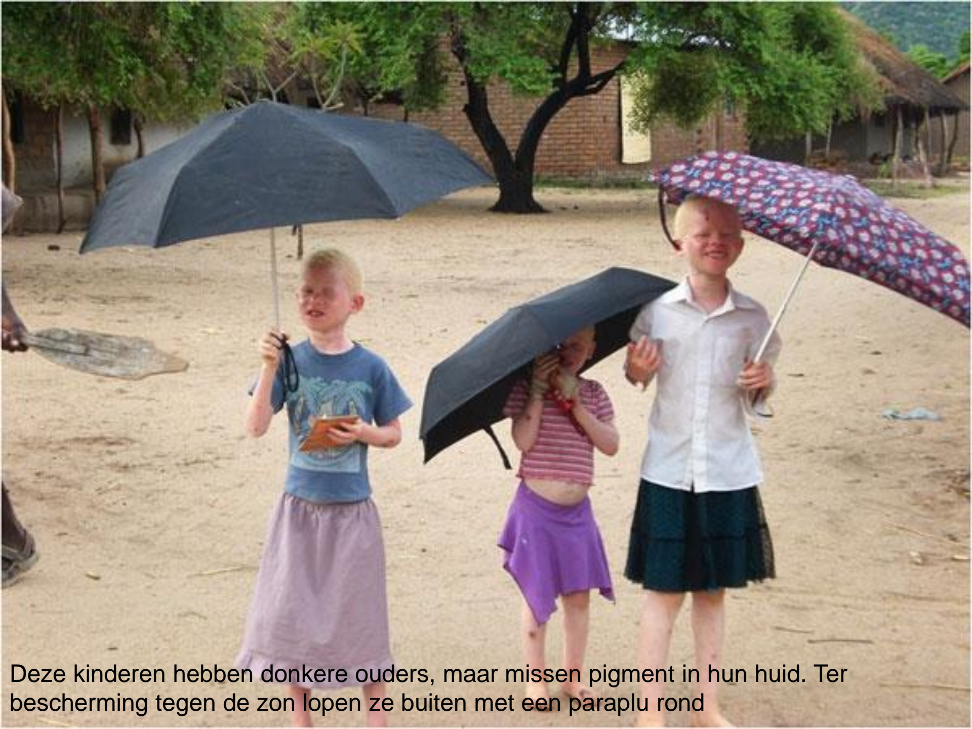
Deze kinderen hebben donkere ouders, maar missen pigment in hun huid. Ter bescherming tegen de zon lopen ze buiten met een paraplu rond