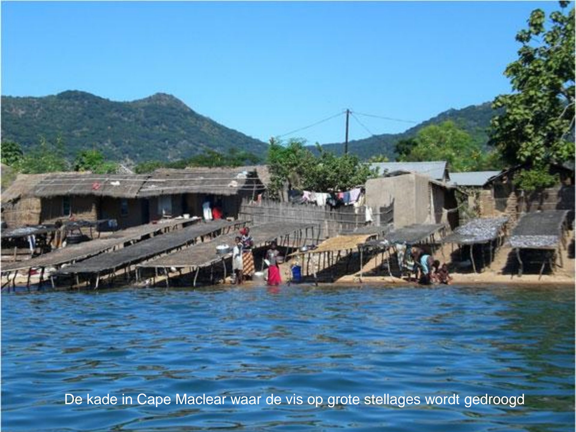
De kade in Cape Maclear waar de vis op grote stellages wordt gedroogd