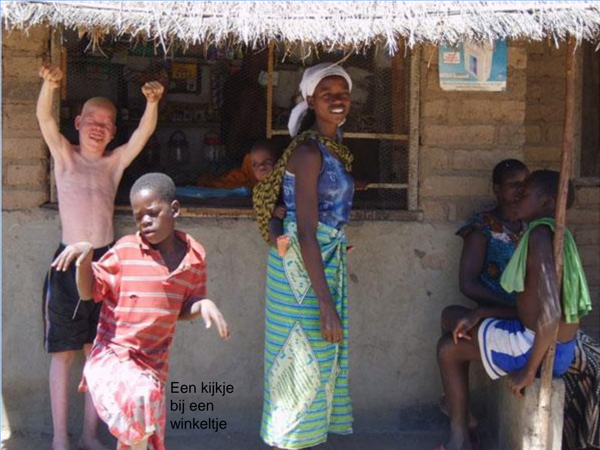
Een kijkje bij een winkelletje